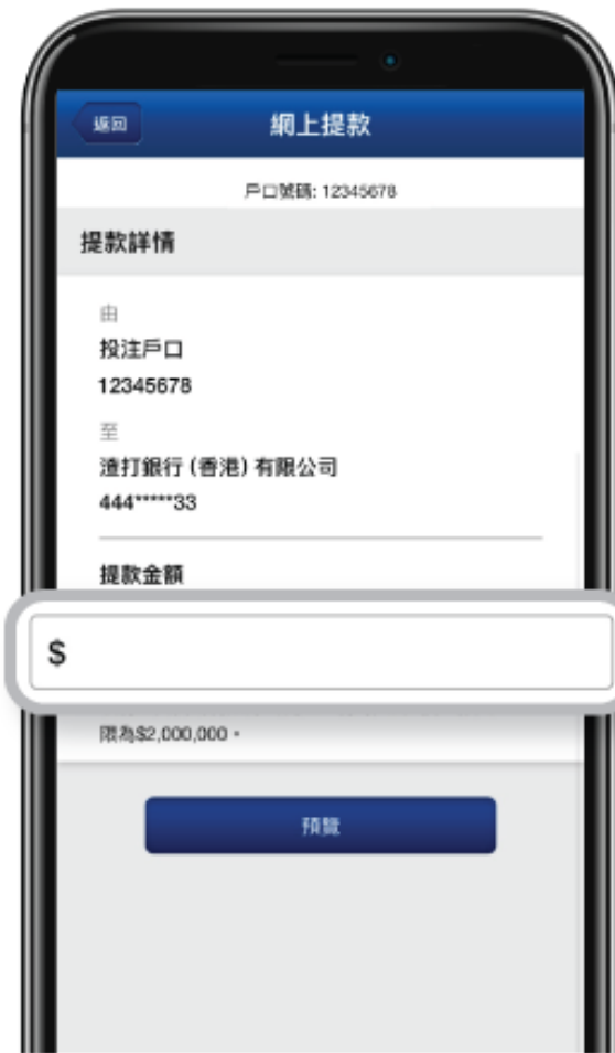
2. 輸入「提款金額」，再按「預覽」