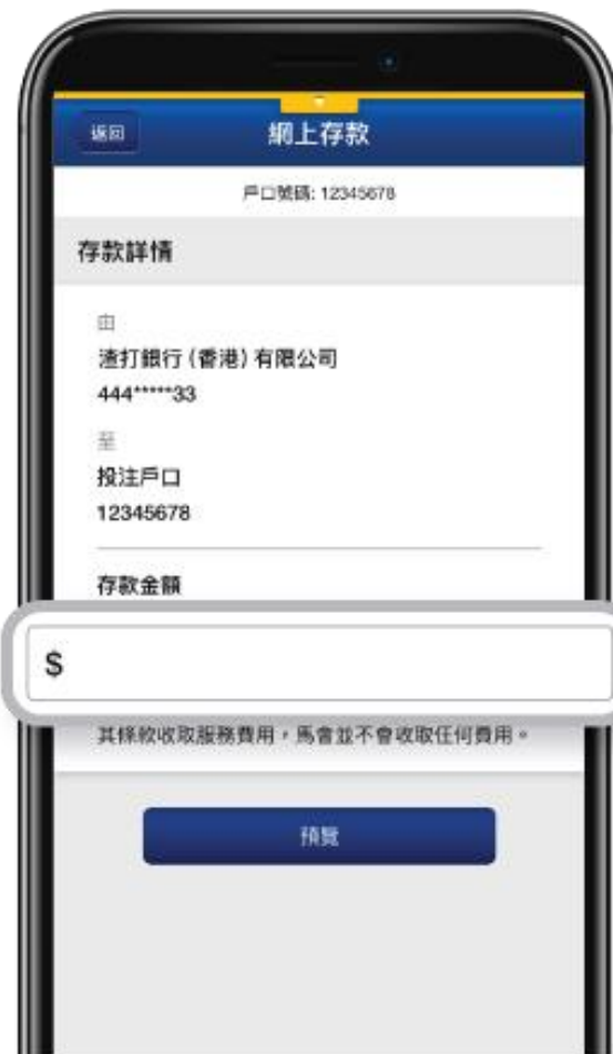
2. 輸入「存款金額」，再按「預覽」